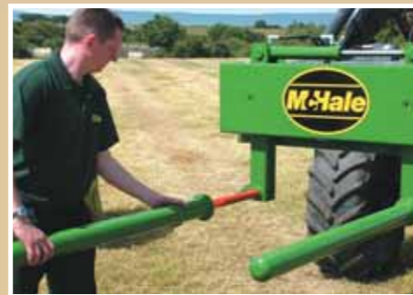
Szabadon forgó görgők