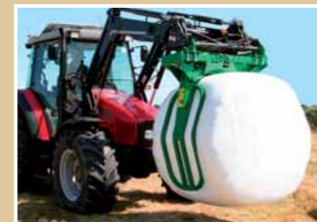
Rögzíthető karok és kiegyensúlyozott fogás