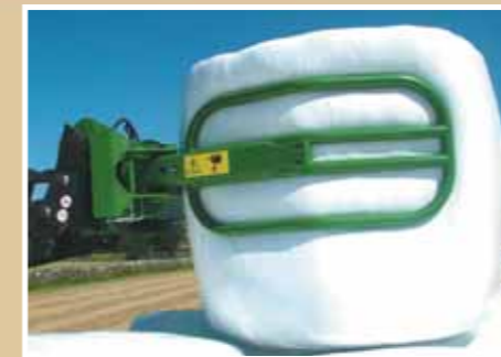
Közelség a rakodó járműhöz