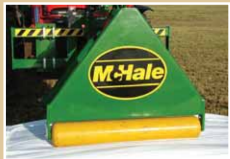
Szabadon forgó görgő