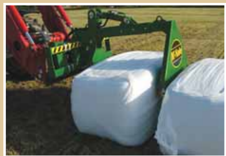
Beállítás különböző bálaméretre