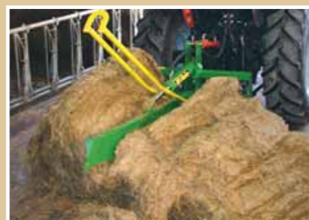
Bálaszállítás vágás után