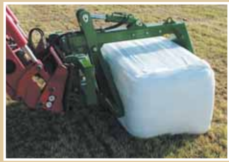
Hátsó fogású kialakítás